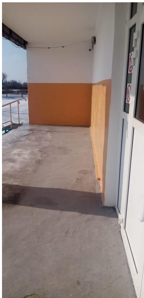
ФОТО № 5