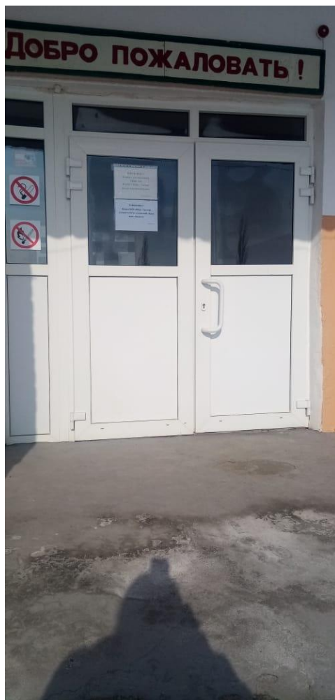
ФОТО № 6