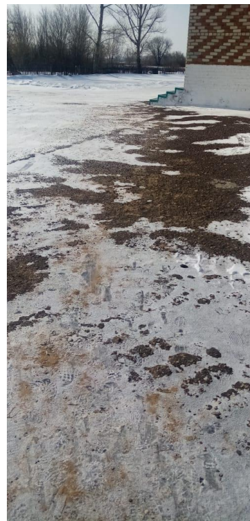
ФОТО № 2