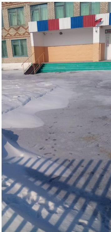
ФОТО № 1