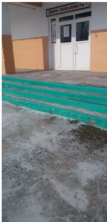
ФОТО № 3