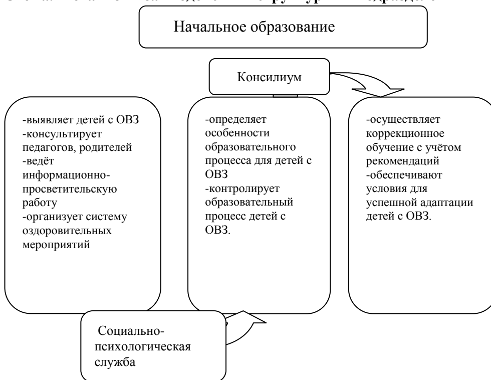
Схема. Механизм взаимодействия структурных подразделений школы